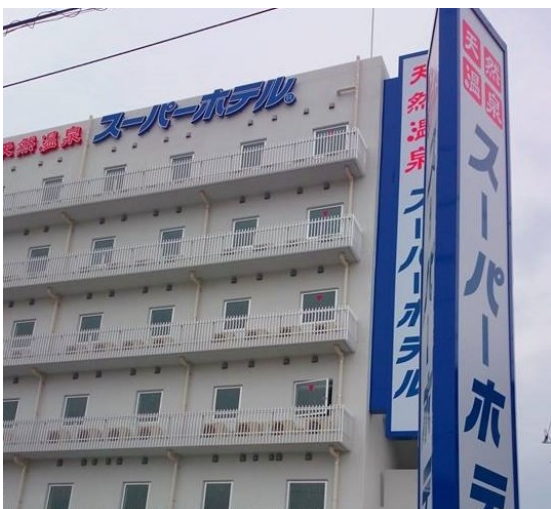
12月25日、スーパーホテルが完成！ オープン初日に宿泊しました！

また預ける側が保育所選びの参考になるような各保育施設の情報をもホームページに集約するよう提案しました。