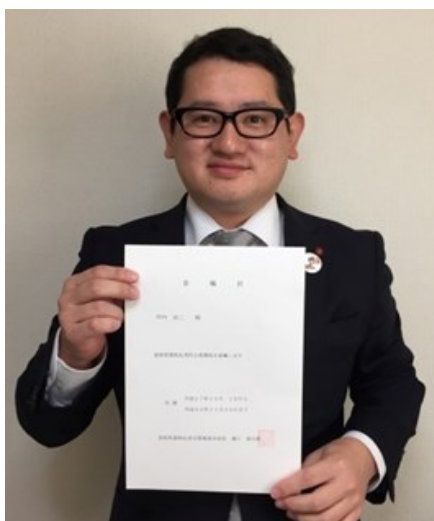
薬物乱用防止指導員として精一杯、取り組みます！

これから研修会などに積極的に参加し、県内及び市内の状況を把握し薬物乱用防止に向け、役割を果たして参ります。