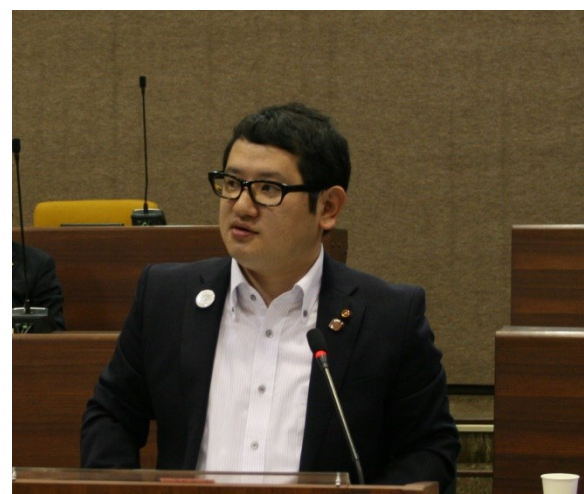
傍聴もできます！ お気軽に議場までお越し下さい！

さらに福祉タクシー券助成事業では、該当者に年間24枚の500円券が支給されるが、障がい者の方が通院や買物など自由に行動するには到底足りず、助成引き上げを求めました。 この他、障がい者の雇用促進、レスパイトケアについて質問しました。