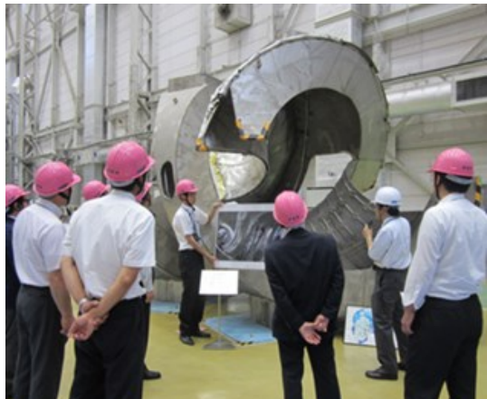
詳しい行政視察報告については市議会ホームページをご覧ください