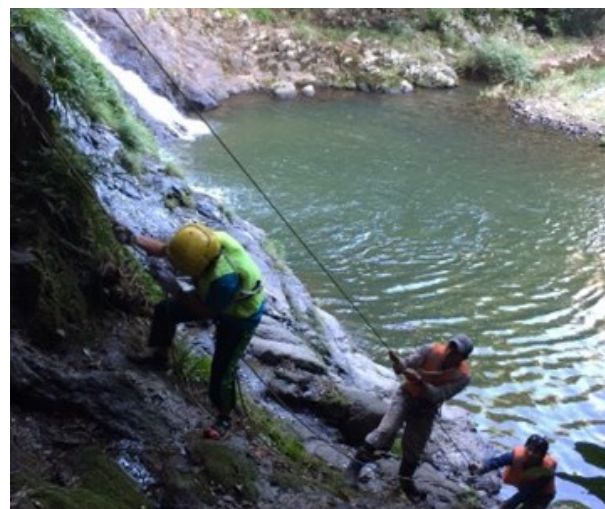
タキッズ修行キャンプ2015に参加 岩瀧寺の滝登りなどを手伝いました