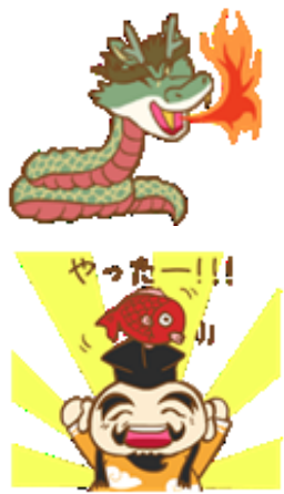
石見神楽スタンプご利用下さい！

学生達が地域の魅力に真摯に向き合い、試行錯誤しながら制作したスタンプを是非ご利用下さい。スタンプは恵比寿や大蛇など4種類のキャラクターからなり、4種類のセットとなっています。購入は、スタンプショップから「石見神楽」で検索して下さい。50コイン（120円）で購入することができます。